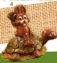
1/GIRAFE ANNE SO H21/L11 cm 2/COCCINELLE H16/L10,5 cm 3/GRENOUILLE GROS YEUX H17/L9 cm 4/LAPIN TORTUE H16/L10 cm