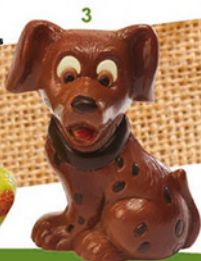
3. CHIEN BONGO H17/L10,5 cm