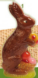
1/DAMIEN LE LAPIN H38/L19 cm 2/TANGUY H47/L22 cm 3/LAPIN PEPIN H58/L20 cm