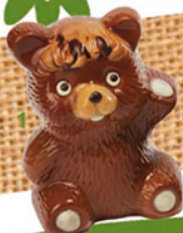
1. NOUNOURS FERGI H14,5/L10 cm

garnis de 100 grs. d'assortiment de chocolats de Pâques