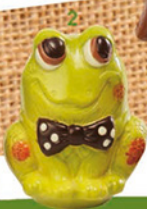
2. GRENOUILLE NOEUD PAP' H12/L8,5 cm 4. AMOUREUX COQUILLE H17/L9 cm