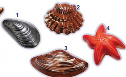
1/MOULE H8/L15/P6 cm 2-SAINT-JACQUES H5/L13/P12 cm 3/PALOURDE H4/L18,5/P10 cm 4/ETOILE DE MER H6/L15/P11 cm garni de 100 grs.

Praliné feuilleté amandes noisettes, assortiment de chocolats Sachet 200 grs. ou 100 grs.